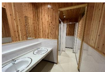
校舎内のトイレは地域材でリノベーション済み。