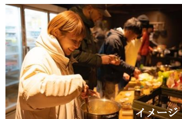
自由に料理、コミュニケーションに活用できる「カウンター&キッチン」

うきは市は福岡県の南東部に位置し、南には耳納連山が連なり、北には筑後川が流れます。いちご、桃、ブルーベリー、ぶどう、梨、柿と年中フルーツが楽しめるため「フルーツ王国」とも呼ばれ、新川・葛籠（つづら）地区の山あいの斜面には「日本棚田百選」にも選ばれた「つづら棚田」が広がる自然豊かな地域です。