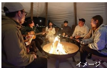
焚火を囲いながら癒しの時間を創出する「ファイヤーピット」