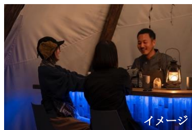
スタッフ達、ゲスト同志で自由な交流を楽しめるカウンターBar併設の「センターハウス」