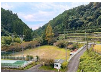
川と緑に囲まれた自然豊かな環境。うきは市街地より車で約15分まで到着する好立地。

「UKIHA RIVERCAMP」は隈上川に隣接し、周囲は緑に囲まれた自然豊かな環境に位置します。夏には川辺を蛍が舞い、幻想的な風景を楽しむことができます。元々学校であった特色も活かしながら、楽しんで滞在していただける様々なコンテンツを準備しております。