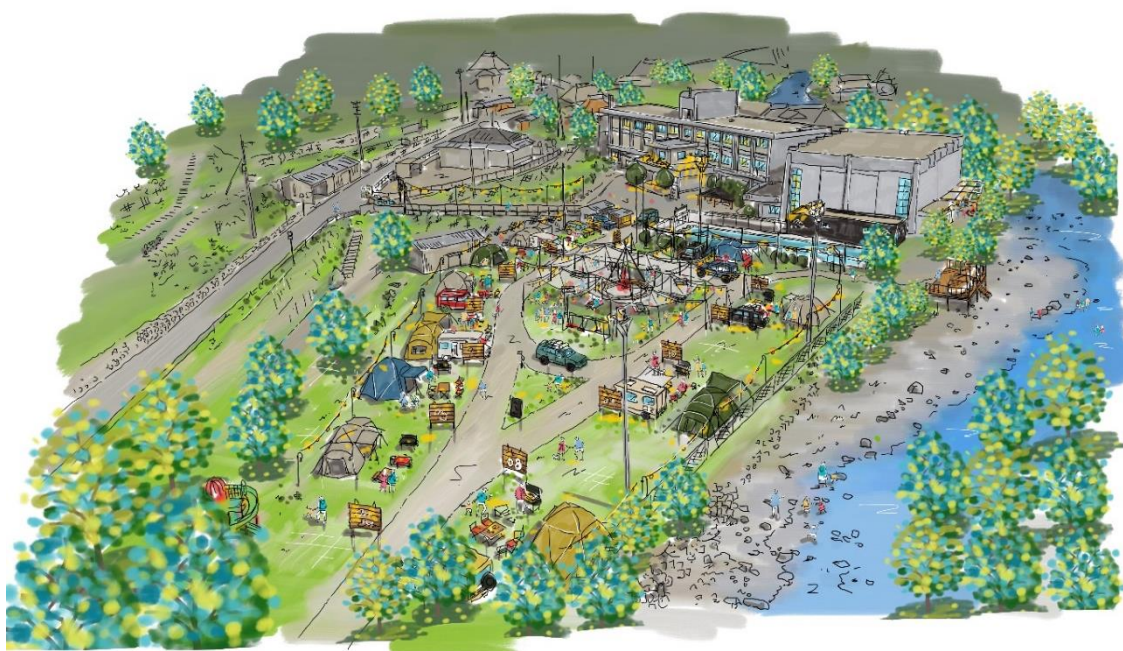
キャンプ場イメージ図